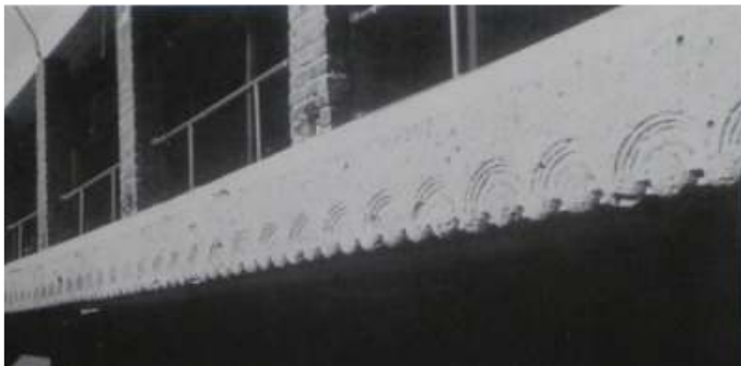
バンケットホール内部、2階レベルにメインフロアを見下ろすギャラリーが周回している。

ライトはこのプロジェクトの最も華やかな空間のバンケットホールを、究極の造形である円を基調として、しかも大きな円を用いてデザインすべく考えたと思われます。そしてこれまで抑え気味にしていた色彩をここで思う存分発揮したことでしょう。