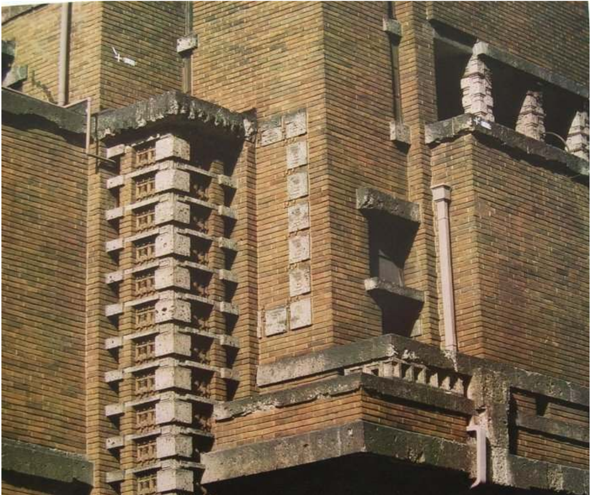
バンケットホール南東部外壁詳細 明石信道著「旧帝国ホテルの実証的研究」より