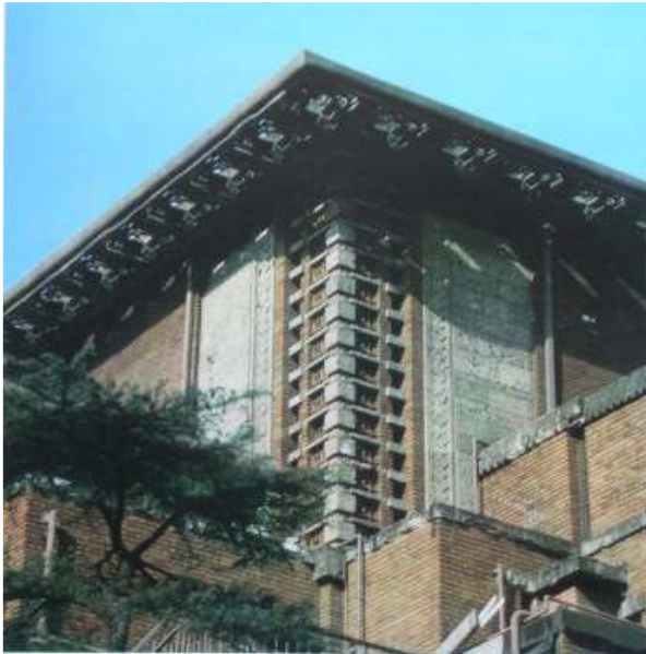
バンケットホール南東部上部外壁 明石信道著「旧帝国ホテルの実証的研究」より 撮影 村井修