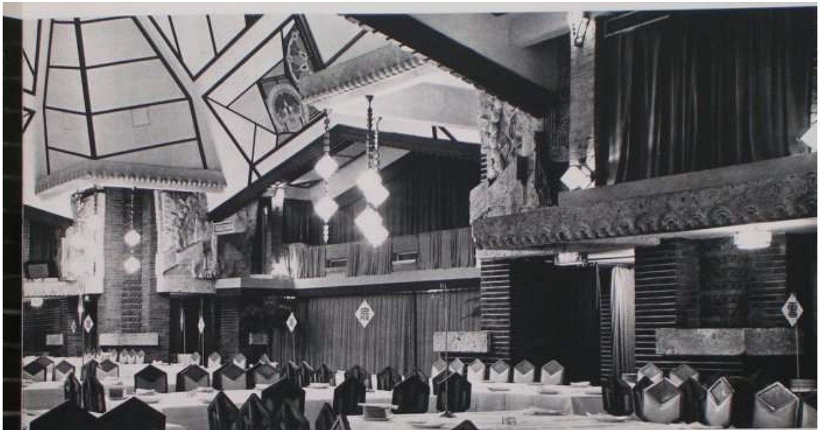
バンケットホールの東側主賓席方向を見る。2階はオーケストラバルコニー。戦後再建されたもの 明石信道著「旧帝国ホテルの実証的研究」より 撮影 村井 修

バンケットホールとは日本語で「饗宴場」と訳されています。また愛称の「孔雀の間」の名前の由来は、ホールの中央フロアー4隅にある柱に施された、孔雀をモチーフにした大谷石のオーナメント(縦横2.2mx2.2m、各2対合計8つ取り付けられている)と、天井に描かれていた同じモチーフによる彩色画によるものです