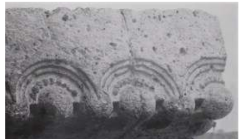
ギャラリー先端部の日本瓦を想起させるレリーフ彫刻